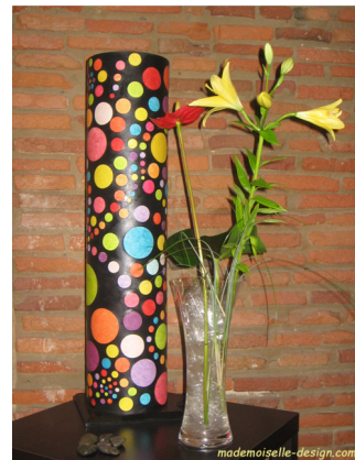
Bigbible (Collection Saturday Night)

Les lampes jouent avec les arabesques, les lignes et les couleurs. Les textures mêlent bois et les fibres végétales, aluminium et plexiglass.