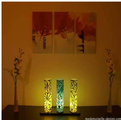
Tryptyk (Collection Sortilège)

Mademoiselle Design imagine et crée les lampes dont on a envie aujourd'hui.